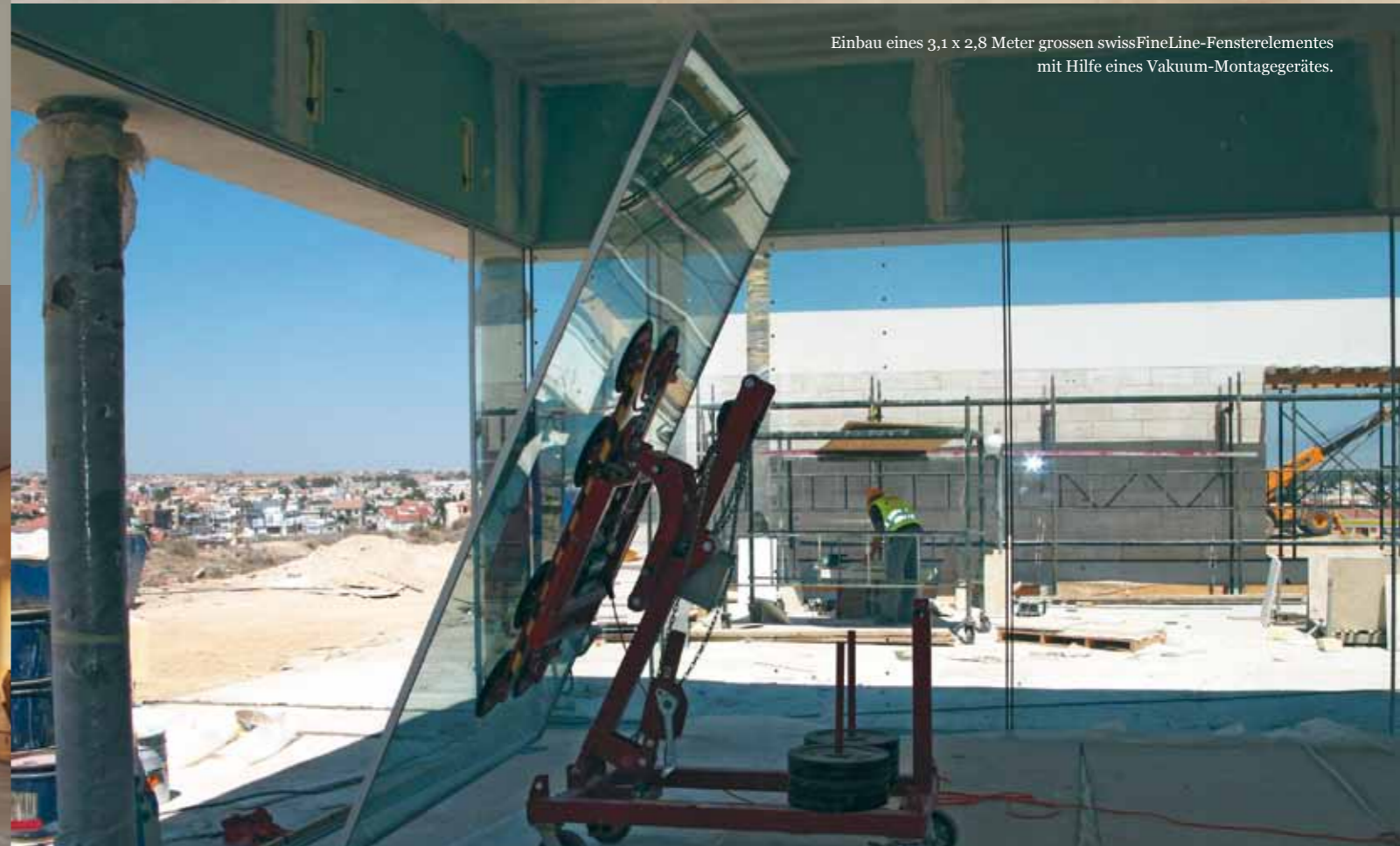
Einbau eines 3,1 x 2,8 Meter grossen swissFineLine-Fensterelementes mit Hilfe eines Vakuum-Montagegerätes.