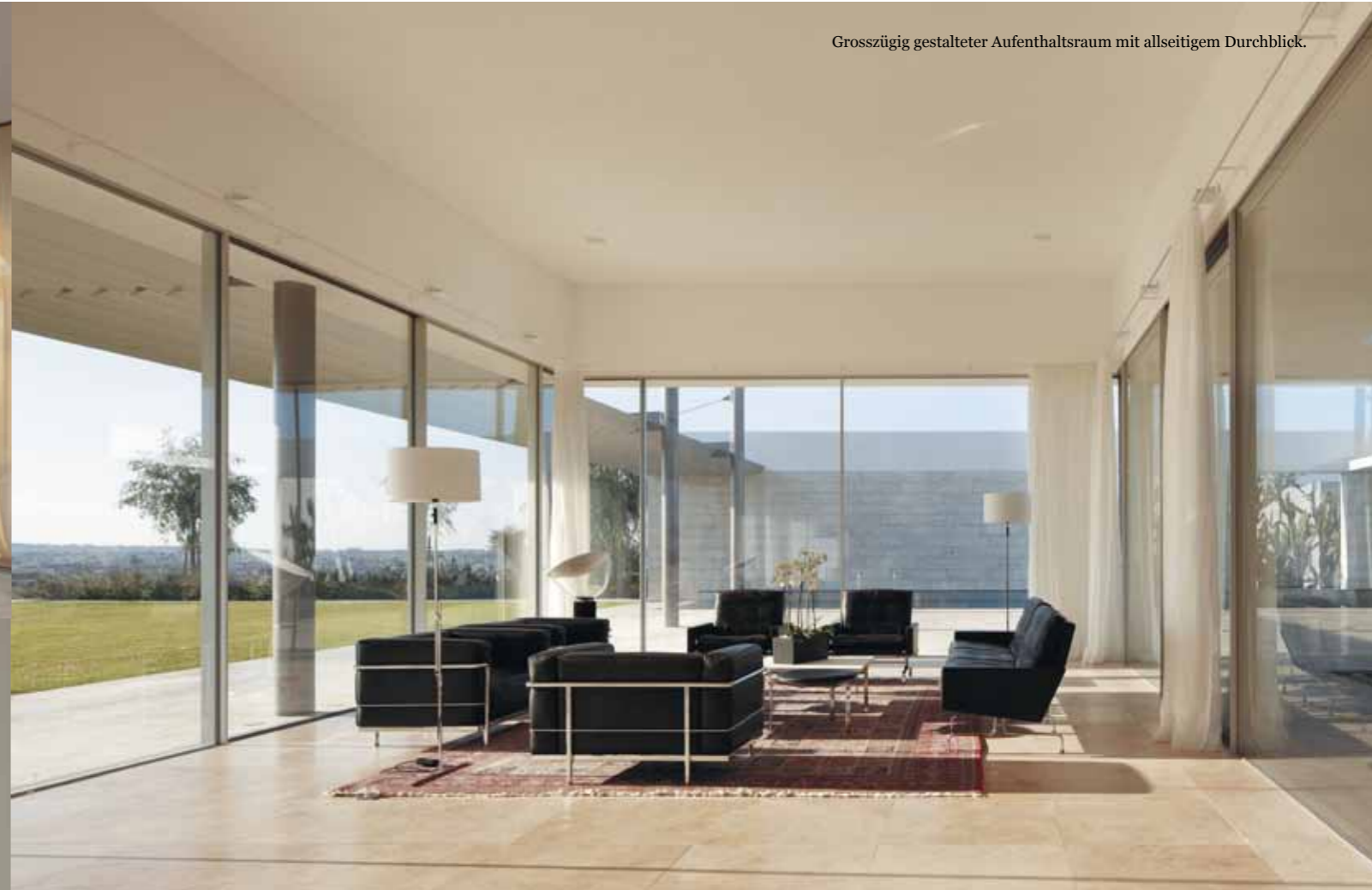
Grosszügig gestalteter Aufenthaltsraum mit allseitigem Durchblick.