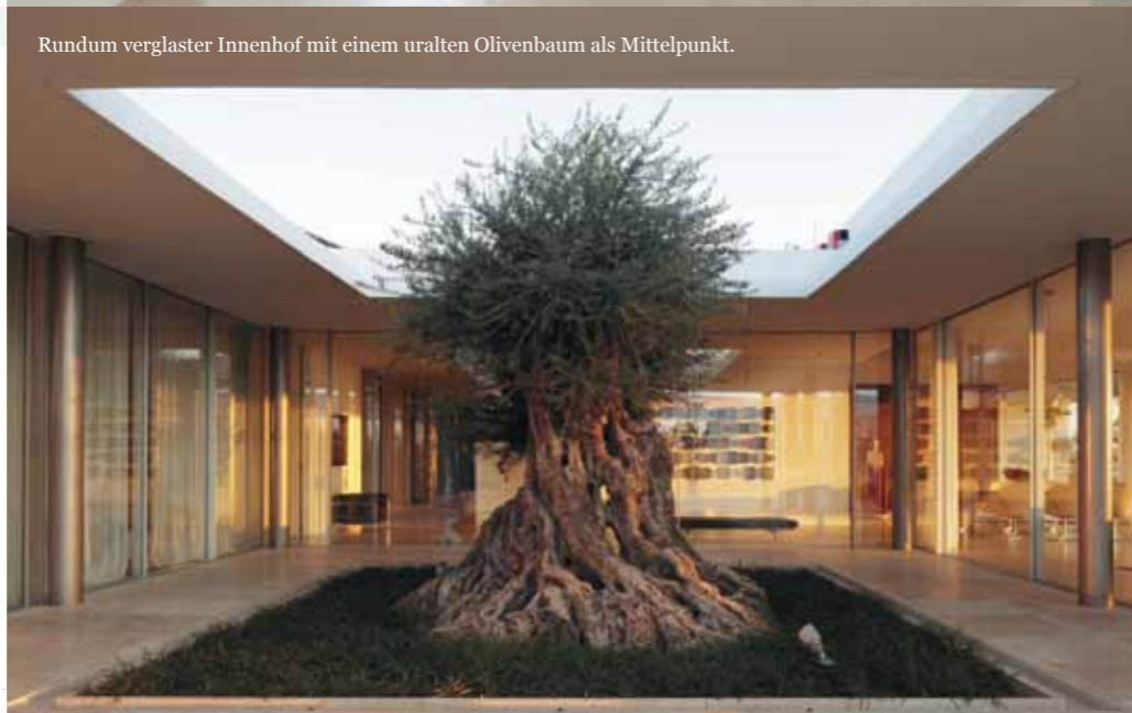
Rundum verglaster Innenhof mit einem uralten Olivenbaum als Mittelpunkt.