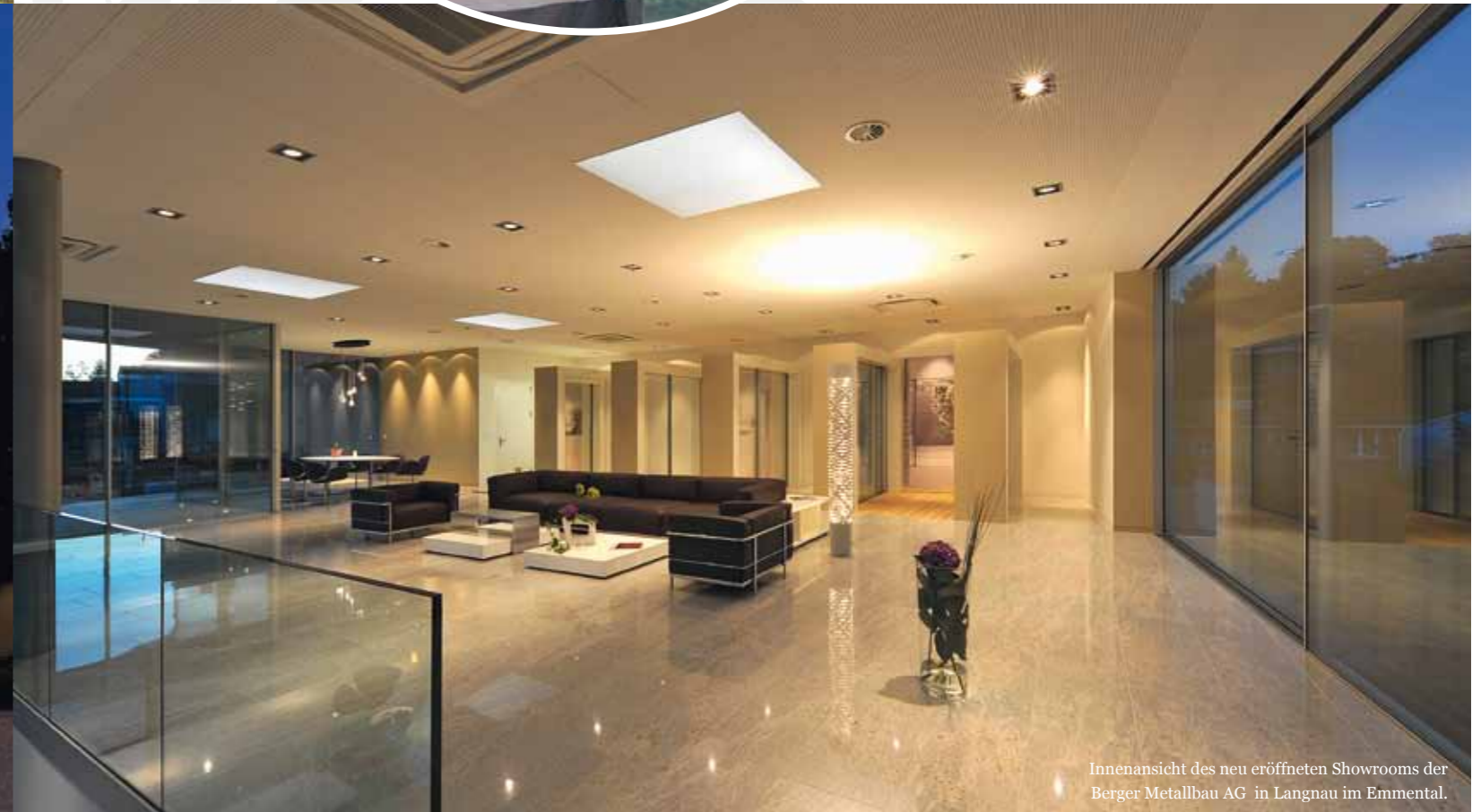
Innenansicht des neu eröffneten Showrooms der Berger Metallbau AG in Langnau im Emmental.