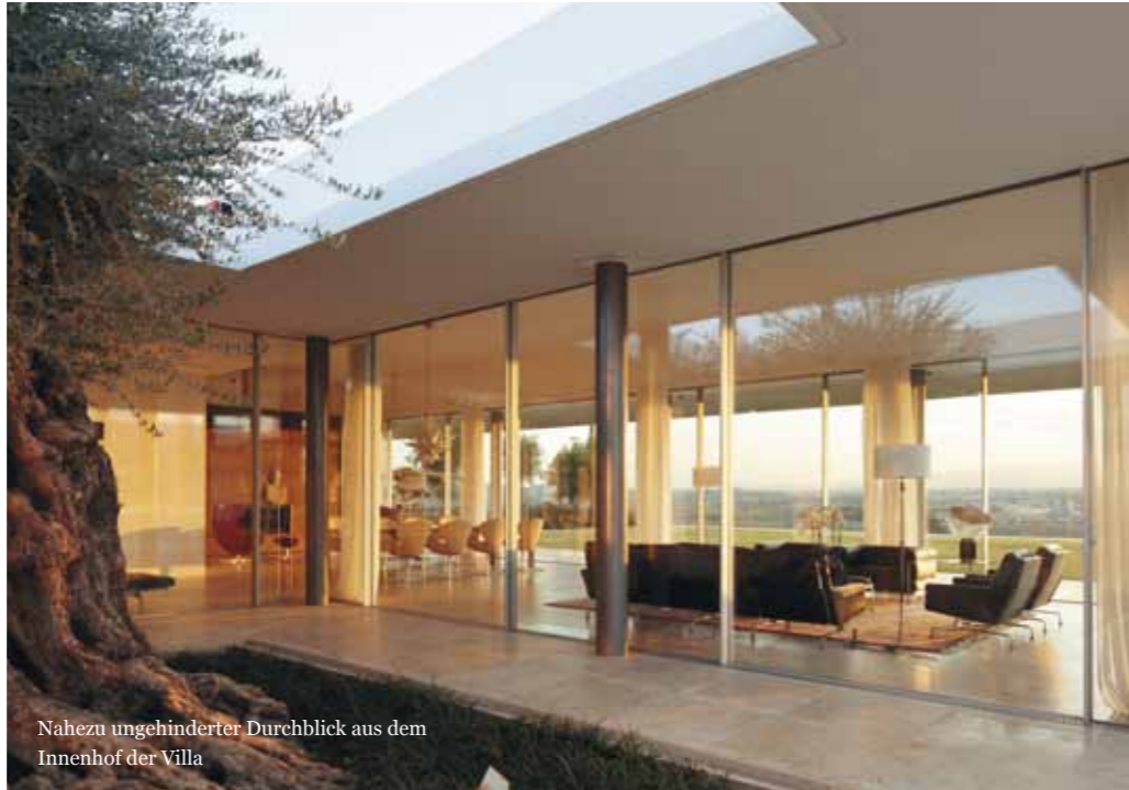
Nahezu ungehinderter Durchblick aus dem Innenhof der Villa

® swissFineLine ist ein eingetragenes Warenzeichen