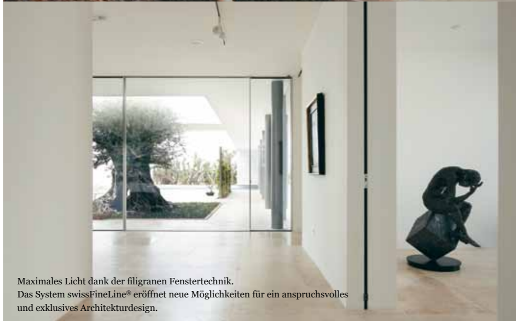
Maximales Licht dank der filigranen Fenstertechnik. Das System swissFineLine® eröffnet neue Möglichkeiten für ein anspruchsvolles und exklusives Architekturdesign.