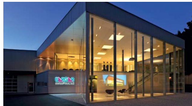
Die grosszügig konzipierte Ausstellung von Berger Metallbau AG in Langnau i.E. präsentiert sich lichtdurchflutet dank «swissFineLine».

Berger Metallbau AG Schlossstrasse 26 3550 Langnau Tel. 034 409 50 50 www.swissfine.ch