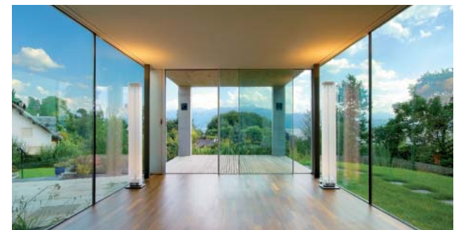
Uneingeschränkte Freisicht und fließende Übergänge zwischen innen und aussen.

Interessierte tauchen ein in die hochinteressante Welt des modernen Bauens und besuchen das «swissFineLine»-Kompetenzzentrum in Langnau. Dort erleben sie im Massstab 1:1 hautnah die filigrane Transparenz.